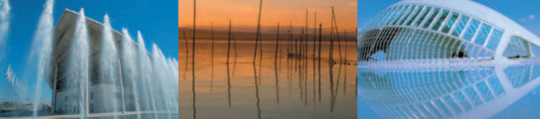
CENTRO DE CONVENCIONES "LAS ARENAS"